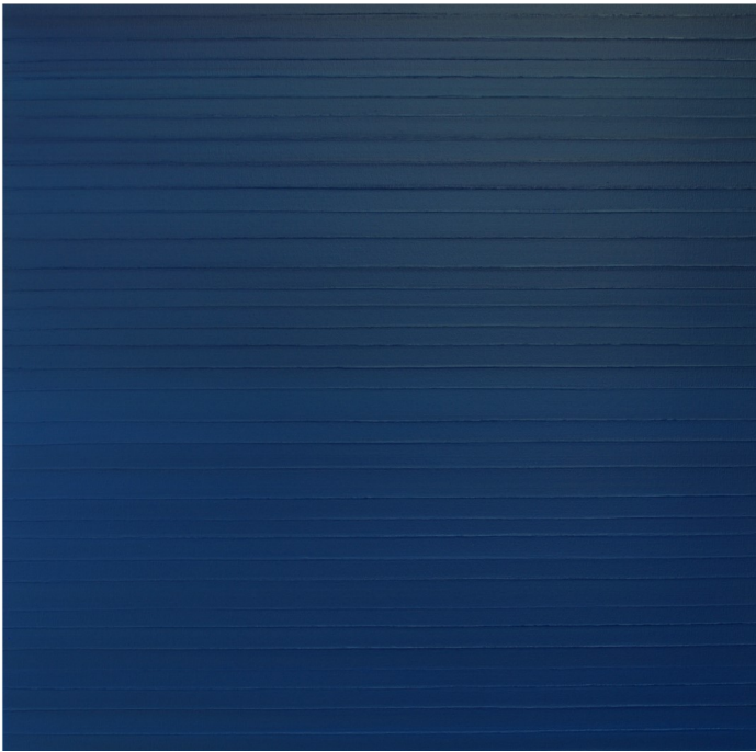
Boyong Kim, ohne Titel, 2017, Acryl auf Leinwand, 100 x 100 cm

Zur Eröffnung der Ausstellung am 16. März 2018 um 19 Uhr